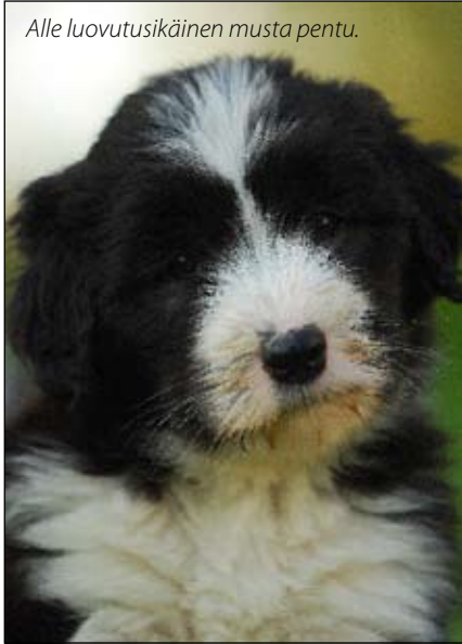
Alle luovutusikäinen musta pentu.

varataan jo ennen luovutusikää. Varaus vastaamaan moniin perhettä ja sen elämäntilannetta koskeviin kysymyksiin. Niiden avulla kasvattaja pyrkii varmistamaan ostajaehdokkaan kyvyn huolehtia pennusta. Mieti myös itse valmiiksi kysymyksiä mm. pentujen vanhemmista ja pentueen hoidosta. Pennun valintaa ei kannata tehdä kevein perustein ja aina toivottu pentu ei löydy ensimmäisellä yrityksellä.